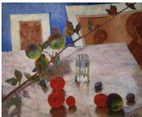
К. Петров-Водкин. Розовый натюрморт.

Натюрморт наиболее показателен и многообразен в плане изучения признаков декоративной стилизации. В нем работали многие большие мастера такие как К. Петров–Водкин, А. Матисс, шли по пути выявления декоративно – экспрессионистических возможностей цвета и фактуры.