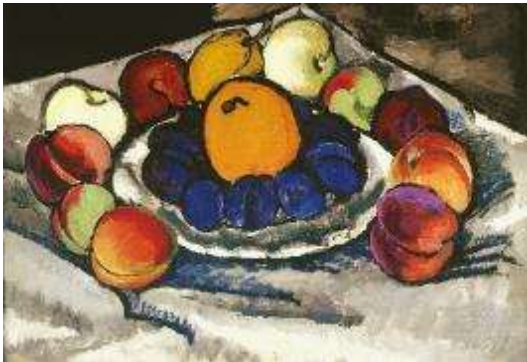
И. Машков. Натюрморт. Фрукты на блюде.

Фовисты создавали колористические контрасты интенсивных пятен и острые композиционные ритмы, часто обращаясь к примитивному, а также средневековому и восточному искусству. Декоративные натюрморты И. Машкова были созданы под влиянием кубистов и фовистов. Машкова называют «королем натюрмортов», и это звание вполне заслужено. «Фрукты на блюде» написаны в период освоения художником плоскостной живописи, жанра вывески.