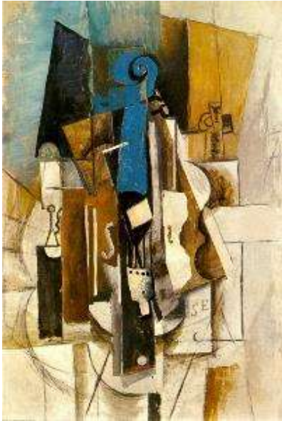
П. Пикассо. Скрипка в кафе.

Фовисты создавали колористические контрасты интенсивных пятен и острые композиционные ритмы, часто обращаясь к примитивному, а также средневековому и восточному искусству. Декоративные натюрморты И. Машкова были созданы под влиянием кубистов и фовистов. Машкова называют «королем натюрмортов», и это звание вполне заслужено. «Фрукты на блюде» написаны в период освоения художником плоскостной живописи, жанра вывески.