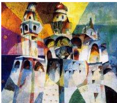
А. Лентулова. Звон (Колокольня Ивана Великого)

Для натюрмортов А. Лентулова, Р. Фалька, Н. Гончаровой характерен культ единства формы и цвета.